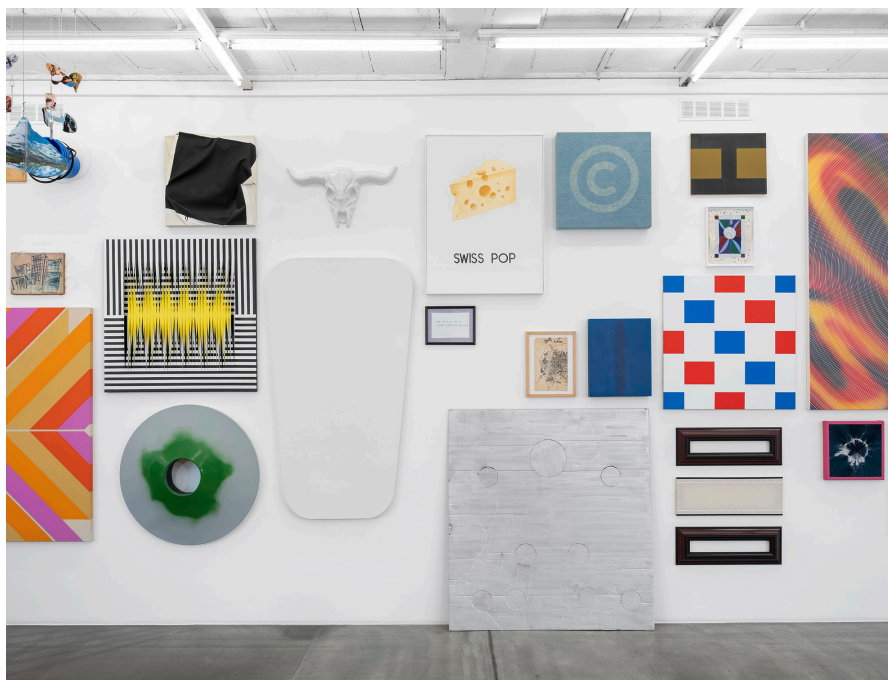
Vue partielle de l'exposition