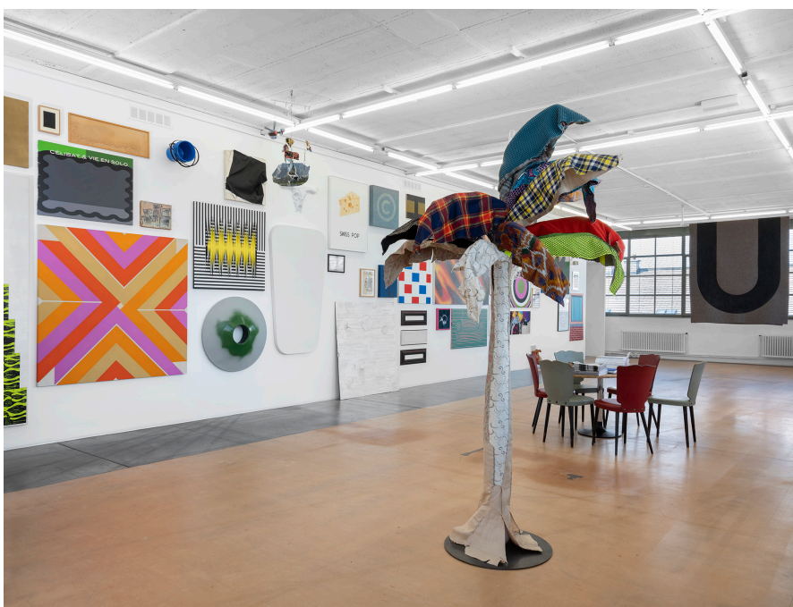
Vue partielle de l'exposition