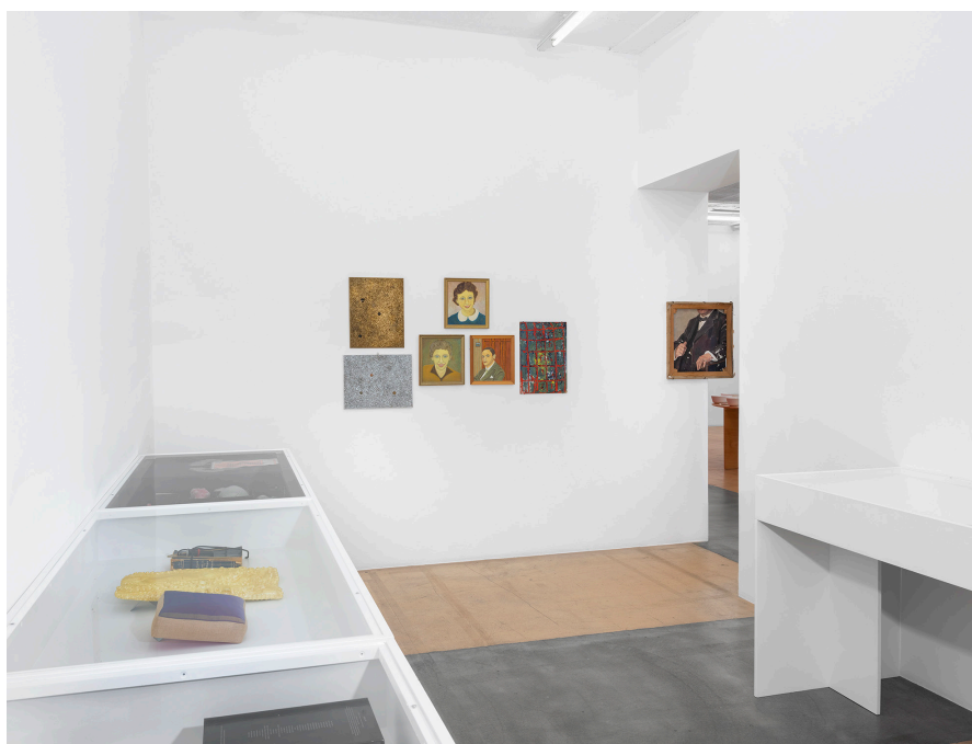
Vue partielle de l'exposition