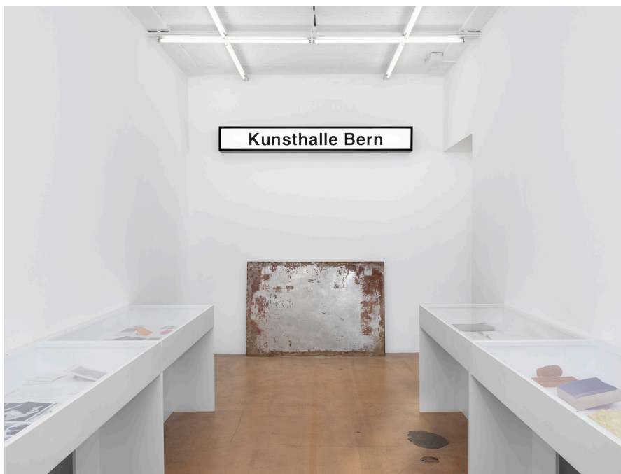
Vue partielle de l'exposition