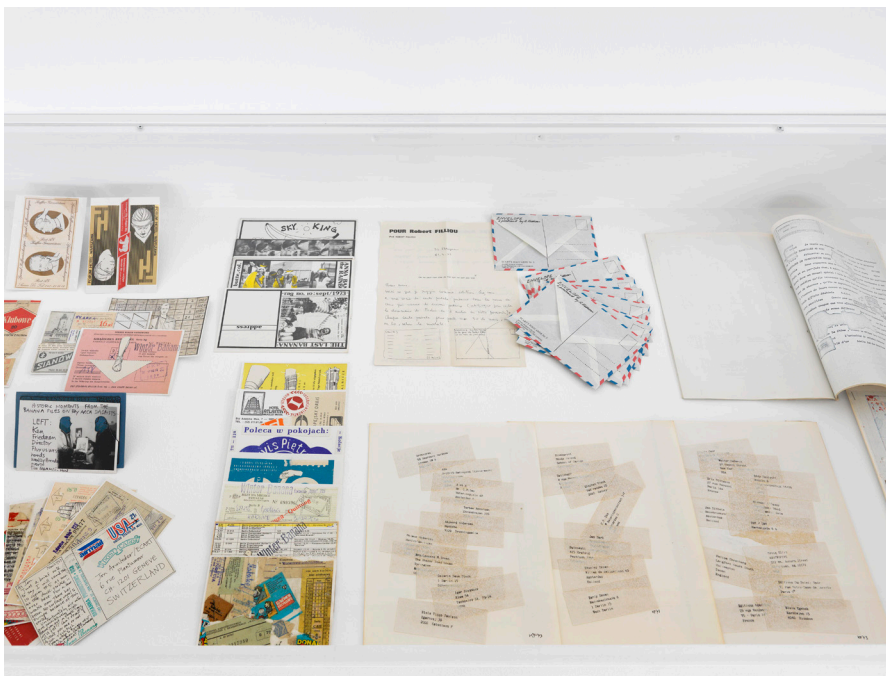
Vue partielle de l'exposition Photos Annik Wetter–MAMCO, Genève