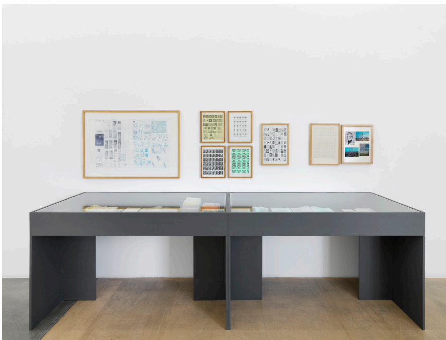
Vue partielle de l'exposition Photos Annik Wetter–MAMCO, Genève