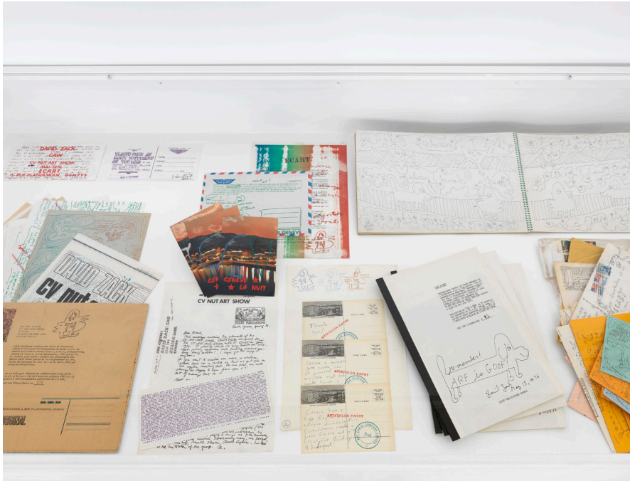
Vue partielle de l'exposition Photos Annik Wetter–MAMCO, Genève