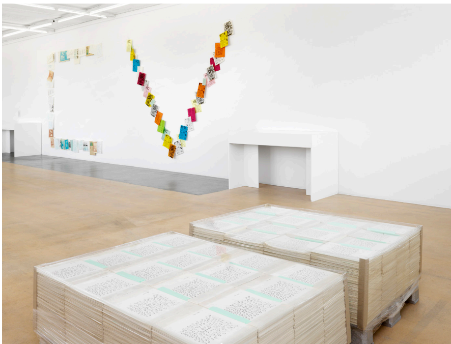
Vue partielle de l'exposition Photos Annik Wetter–MAMCO, Genève