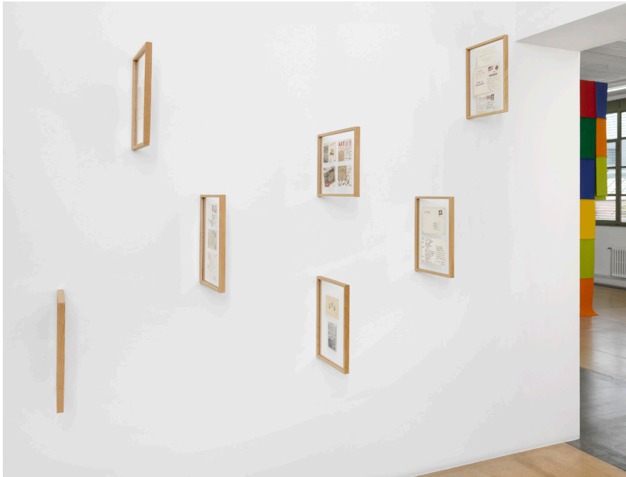
Vue partielle de l'exposition Photos Annik Wetter–MAMCO, Genève