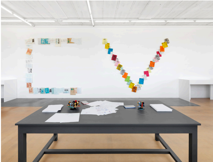
Vue partielle de l'exposition Photos Annik Wetter–MAMCO, Genève