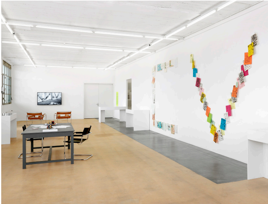
Vue partielle de l'exposition Photos Annik Wetter–MAMCO, Genève