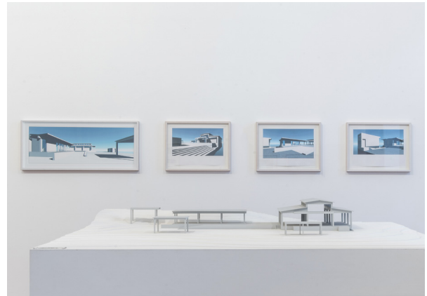
Martin Kippenberger, The Museum of Modern Art Syros, vue de l'exposition , Fondazione Sant'Elia, Palerme, 2018