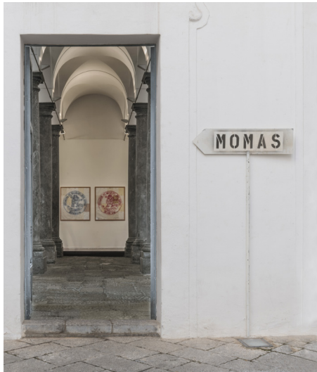
Martin Kippenberger, The Museum of Modern Art Syros, vue de l'exposition Fondazione Sant'Elia, Palerme, 2018