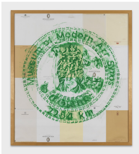
Martin Kippenberger, Momas Hiking , 1997 frottage au pastel gras sur papier-en-tête d'hôtels 118.50 x 104.50 cm (avec cadre) édition coll. MAMCO