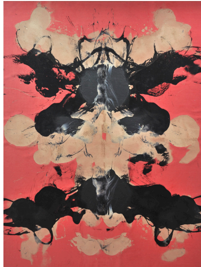
Mai-Thu Perret, The Crack-Up IV , 2009 Acrylique sur tapis monté sur bois 240 x 180 cm