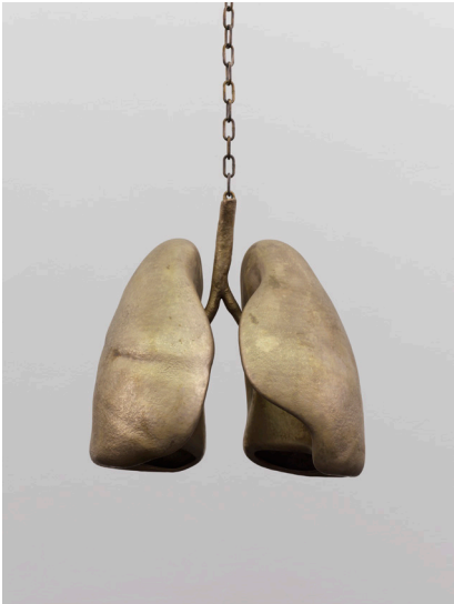
Mai-Thu Perret, Eventail des caresses (Poumons) , 2018 Bronze, dimensions variables Collection Mai-Thu Perret