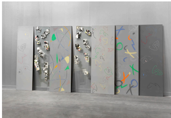
Marc Camille Chaimowicz, Geneva Diptych, Leaning... with Chorus Girls and Sentinels , 1984 Polyptyque, huile et peinture synthétique sur bois, photographies en noir et blanc colorisées pour certaines et disposées entre deux plaques de verre. 7 éléments 4 x (180 x 60 cm) 2 x (180 x 40cm) 1 x (180 x 48 cm), épaisseur 1.5 cm Collection MAMCO