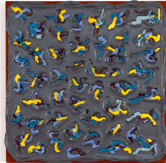
Cynthia Carlson, Animated Struggle , 1976 Acrylique sur toile 61 x 61 cm courtoisie de l'artiste Photo : Karen Bell