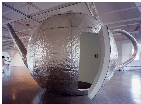
Mai-Thu Perret, Little Planetary Harmony , 2006 Aluminium, bois, plâtre, peinture latex, néon, acrylique sur bois, peintures à l'intérieur (acrylique sur bois) 356 x 643 x 365 cm Coll. Aargauer Kunsthaus, Aarau