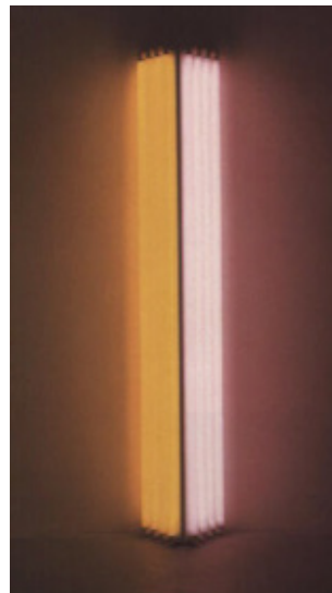
Dan Flavin, Untitled (Fondly to Margo) , 1986 ed. 1/3, lampes fluorescentes jaune et rose 243,8 x 243,8 x 21,6 cm Fondation Mattioli-Rossi, dépôt MAMCO