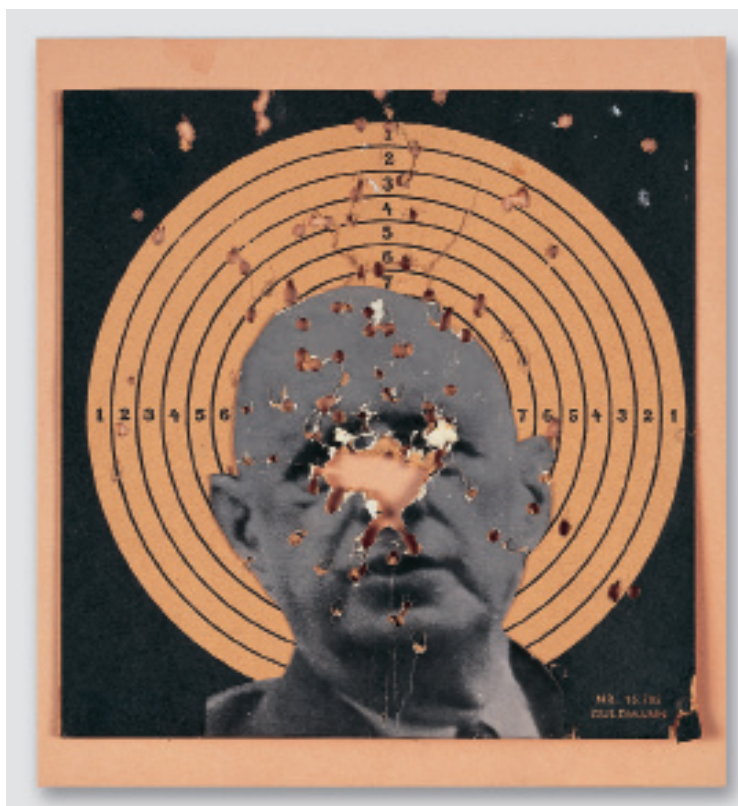
Œuvre sur papier, collage et relique de performance Charles de Gaulle (Président français) sur une cible de tir, 1963 Destruction de RSG6 , Galerie Exi, Odense (Danemark), 1963