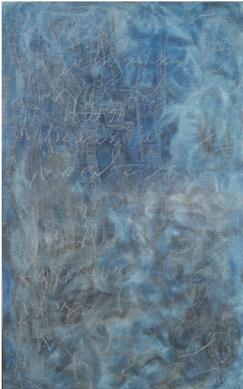
Gil Joseph Wolman Ecriture gestuelle sur fond bleu , 1962 Ecriture et huile sur toile, 162 × 97 cm Collection particulière